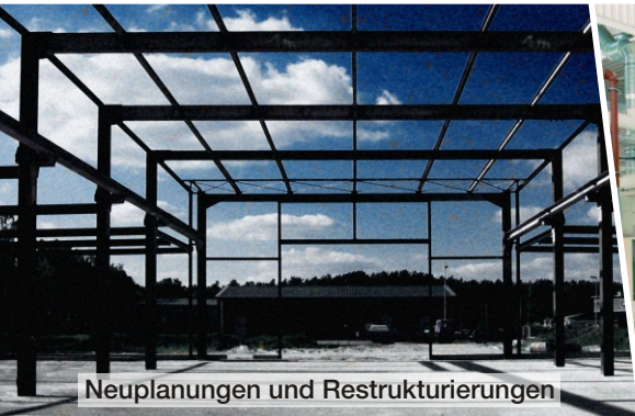
Neuplanungen und Restrukturierungen

Neben hocheffizienten Produktionssystemen zeichnen sich erfolgreiche Unternehmen durch ein hocheffektives und flexibles Produktionsmanagement aus. Proing unterstützt Sie dabei, dieses Ziel zu erreichen und nachhaltig zu sichern.